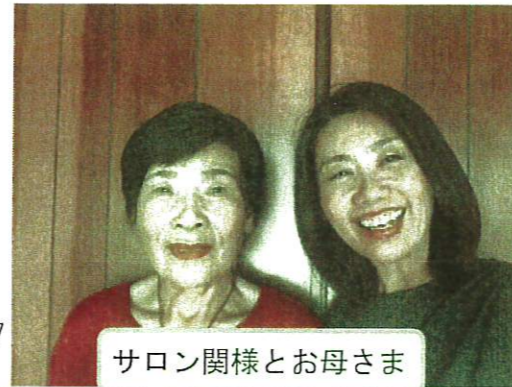
サロン関様とお母さま

〒310-0841 茨城県水戸市酒門町 3013-6TEL / 070-3141-4007